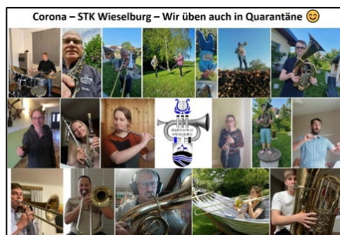
Die Stadtkapelle beim Proben im Lockdown

Doch es kam anders. Der erste Lockdown stellte unsere kompletten Vereinsaktivitäten ein. Wir stoppten zwar die gemeinsamen Proben, aber probten zuhause fleißig weiter, um gewappnet zu sein für den wahrscheinlich sehr intensiven Herbst. Der Challenge von Facebook haben wir uns auch gestellt und davon eine Collage aus den Übungs-Fotos hergestellt.