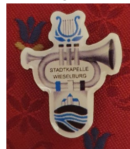
Unsere neuen Ansteck-PINs

Wir brachten in dieser Zeit auch unser Musikheim auf Vordermann bzw. Vorderfrau und organisierten die Uniformen und die Uniformablage neu und kauften einen Uniform-Kasten. Als Erkennungszeichen haben wir nun auch Ansteck-PINs. Auch die thermische Schwachstelle unter der Fensterfront isolierten wir mit einer Holz-Vorsatzdämmung.