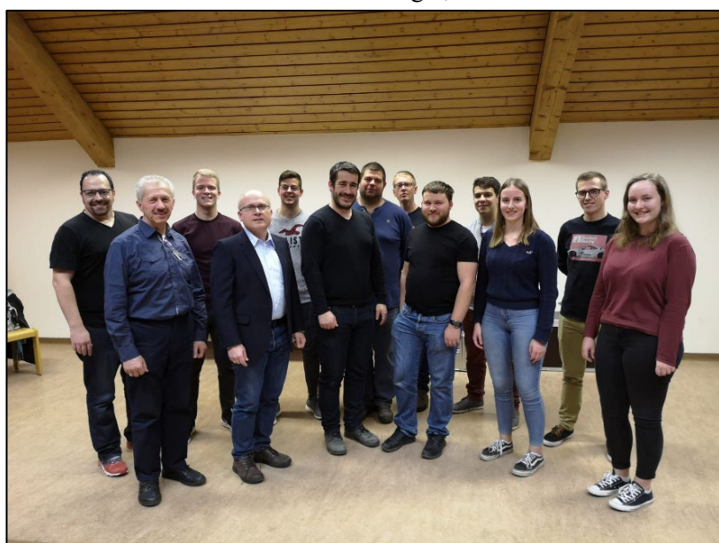
Der 2020-er-Vorstand der Stadtkapelle Wieselburg

Wir begannen voller Optimismus mit den Proben für unseren Heimatabend „Klingendes Wieselburg“ . Wir hatten ein anspruchsvolles und interessantes Programm zusammengestellt und die „Wieselburger Tanzlmsi“ wäre unser Gast gewesen, um gemeinsam für alle Besucher einen unterhaltsamen Abend zu gestalten.